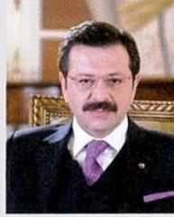
Rifat HİSARCILIOĞLU / Türkiye Odalar ve Borsalar Birliği (TOBB) Başkanı

Cumhuriyetin ilanının 100. yıldönümü olan 2023'ü, gururla ve coşkuyla ama aynı zamanda buruk bir şekilde geri bırakıyoruz. Senenin başında asrın felaketi olan nitelendirilen deprem kâbusunu 11 ilimizde yaşadık. Senenin sonunda İsrail'in Gazze'de gerçekleştirdiği vicdansız ve acımasız saldırının dehşetiyle sarsıldık. Ekonomideyse enerji ile gıdadaki arz ve tedarik sorunları, yüksek enflasyon, jeopolitik gerilimler ve savaşların olumsuz yansımalarıyla karşılaştık. Yaşanan tüm zorluklara rağmen 2023 yılında ekonomide beş alanda rekor kırdık. Üretim hacminde (GSYİH) ilk